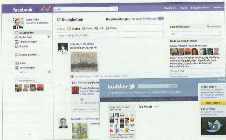
Die zunehmende Bedeutung von Social-Media-Marketing stellt auch die Affiliate-Marketing-Branche vor neue Herausforderungen